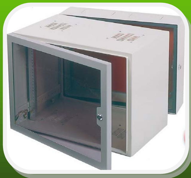
Las fotos presentadas son a título informativo, los productos pueden sufrir modificaciones sin previo aviso.

Vinculación de tierra entre cuerpos y puerta.